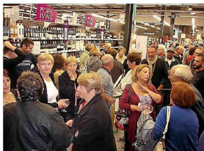
■ Un public un peu moins nombreux que les autres années.

Les visiteurs ont pu exercer leurs talents sensoriels en jouant avec la cave aux arômes, d'étranges tuyaux exhalant les arômes caractéristiques des vins aux trois couleurs. Histoire de tester ses connaissances.